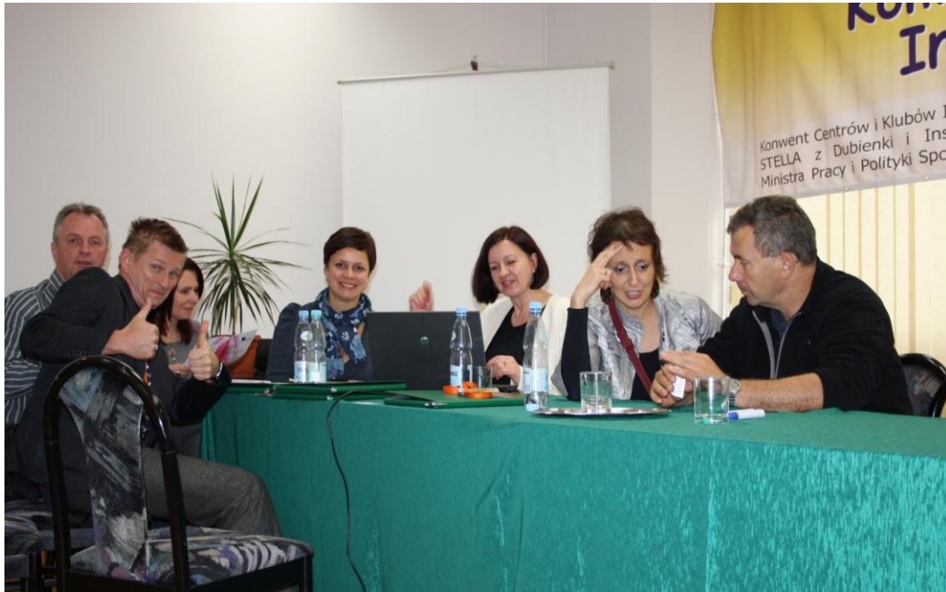
Zespół ds. promocji i komunikacji podczas pierwszego spotkania roboczego

postulatów i stanowisk odnośnie przyszłego okresu programowania EFS 2014-2020, celem uwzględniania podmiotów zatrudnienia socjalnego jako beneficjenta środków UE, Występowanie jako reprezentacja środowiska podmiotów zatrudnienia socjalnego w kontaktach z Regionalnymi Ośrodkami Polityki Społecznej przy formułowaniu priorytetów, działań i celów regionalnych.