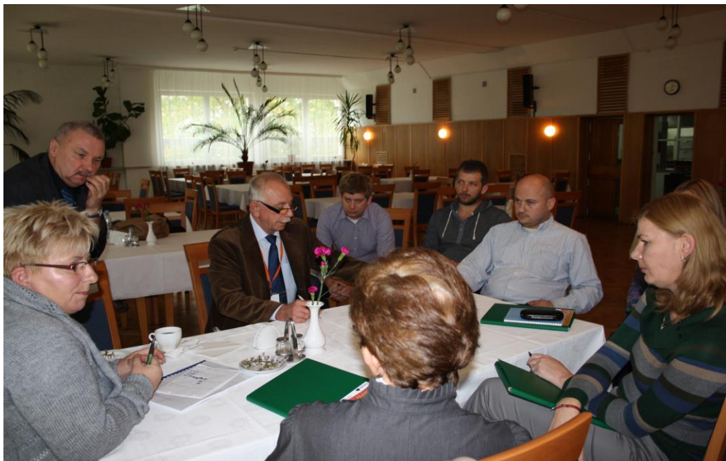
Zespół ds. perspektywy finansowej 2014-2020 podczas pierwszego spotkania roboczego

postulatów i stanowisk odnośnie przyszłego okresu programowania EFS 2014-2020, celem uwzględniania podmiotów zatrudnienia socjalnego jako beneficjenta środków UE, Występowanie jako reprezentacja środowiska podmiotów zatrudnienia socjalnego w kontaktach z Regionalnymi Ośrodkami Polityki Społecznej przy formułowaniu priorytetów, działań i celów regionalnych.