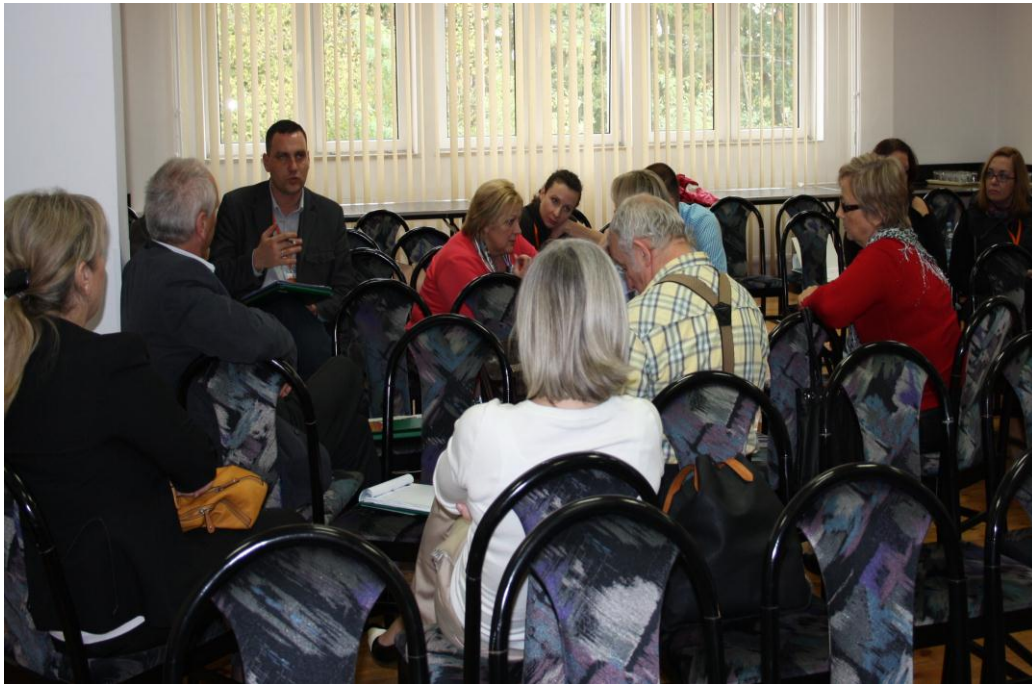
Zespół ds. Legislacji podczas pierwszego roboczego spotkania